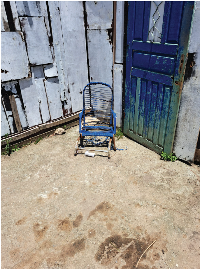
Figura 2. Mobiliário residencial que com o tempo não escapa de virar lixo (que não é biodegradável). Autora: Francine Cruz de Cerqueira Lima, 19/12/2023.