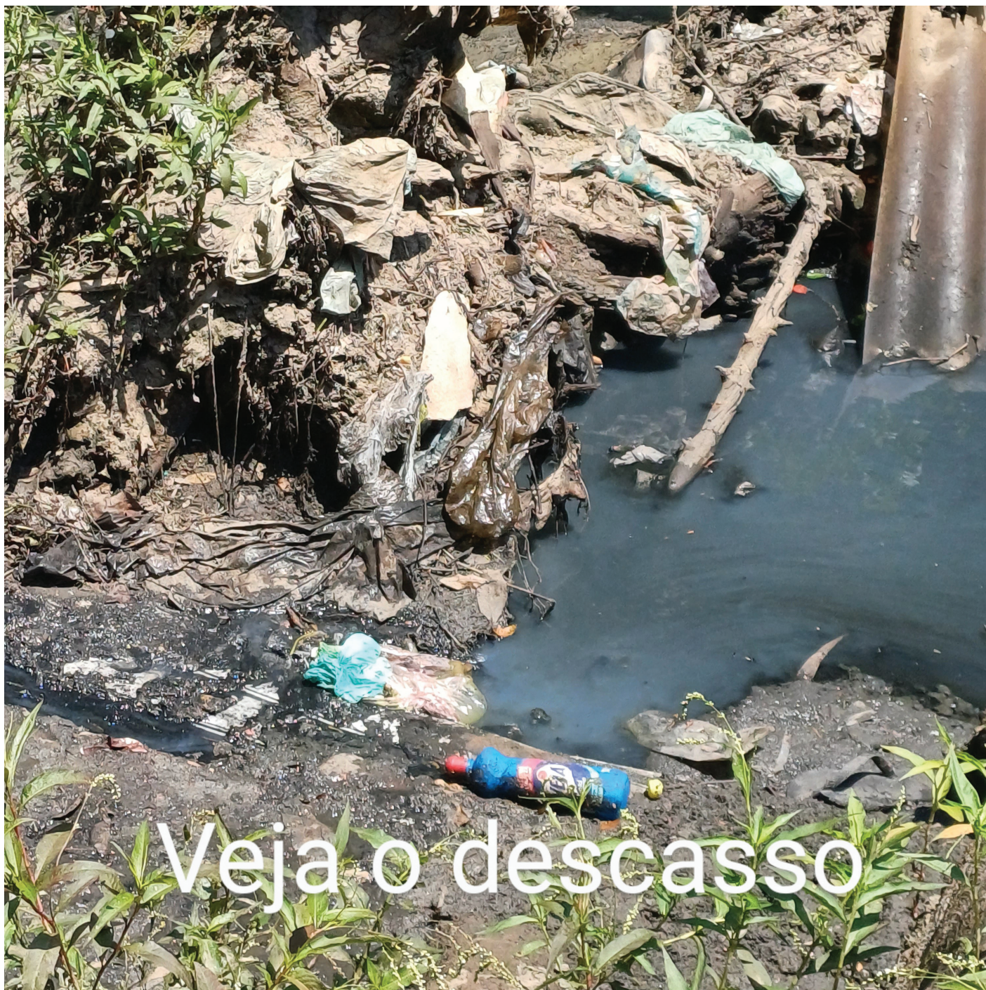
Figura 5. "A Foto retrata o descaso com a população do Keralux com o rio contaminado, esgoto sendo despejado e sujo com plásticos e outros objetos, chamando atenção por meio da imagem da embalagem plástica do produto de limpeza de nome Veja". Autor: Fabio Luiz Cardozo, 19/12/2023.

Após a caminhada voltamos para a sala de aula para fazer uma rápida reflexão da experiência e do método. A técnica permitiu que os participantes capturassem imagens que representassem suas perspectivas, seus olhares individuais e que depois foram compartilhadas com o grupo. Foi possível perceber neste exercício no bairro Jardim Keralux um novo olhar dos participantes sobre a onipresença do plástico, especialmente em áreas periféricas da cidade, cuja ausência de serviços regulares de coleta de resíduos, desvelam o descaso das autoridades públicas em relação aos moradores dessas localidades.