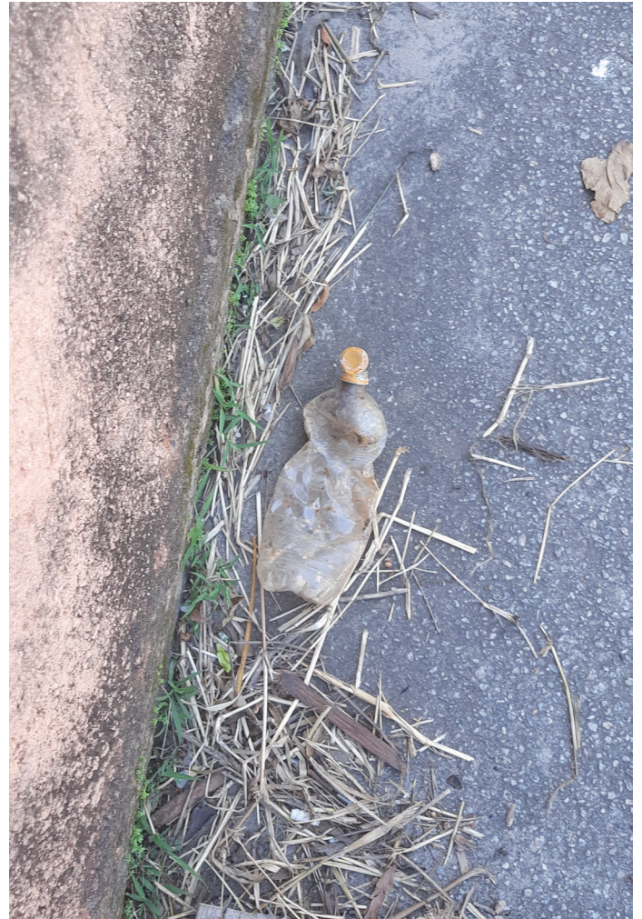
Figura 4: "A foto retrata a luta da comunidade do Keralux para ter acesso aos direitos básicos que são negados pelo Poder Público. É uma história de resistência solitária e diária". Autor: Rodrigo Massao Kurita, 19/12/2023.