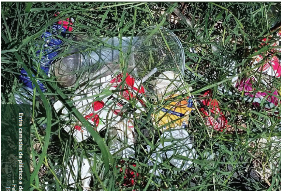
Figura 3. A colonização do plástico: "Esta foto retrata um pedaço de sacola que ondulava-se como uma bandeira e que nos lembra como o plástico tem colonizado as nossas vidas e hábitos sociais, poluindo todos os ecossistemas do planeta". Autor: Felipe Torres, 19/12/2023.